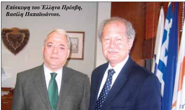
Επίσκεψη του Έλληνα Πρέσβη, Βασίλη Παπαϊωάννου.