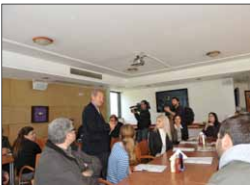
Γεύμα γνωριμίας με τους εκπροσώπους των ΜΜΕ στο Πάρκο Ακροπόλεως