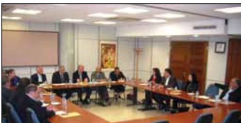
Επίσκεψη αντιπροσωπείας του ΑΚΕΛ, με επικεφαλής το ΓΓ του κόμματος κ Άντρο Κυπριανού παρακάθησε σε σύσκεψη με το Δήμαρχο Στροβόλου, Αρα Αάζαρο Σαββίδη, τους επικεφαλής των Δημοτικών Ομάδων, μέλη του Δημοτικού Συμβουλίου και το Δημοτικό Γραμματέα του Δήμου Στροβόλου.