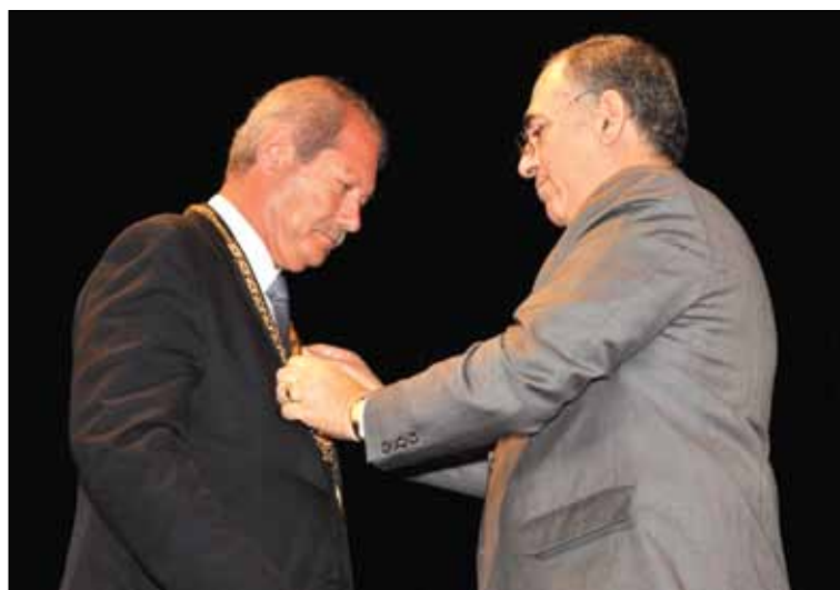
Η στιγμή παράδοσης της δημαρχίας από τον τέως Δήμαρχο, στον νυν.