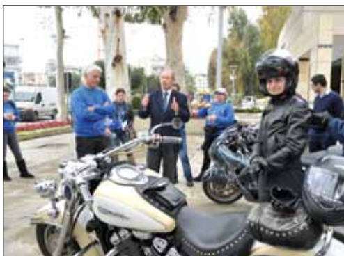
Έναρξη πορείας μοτοσυκλετιστών «ένα όνειρο – μια ευχή».