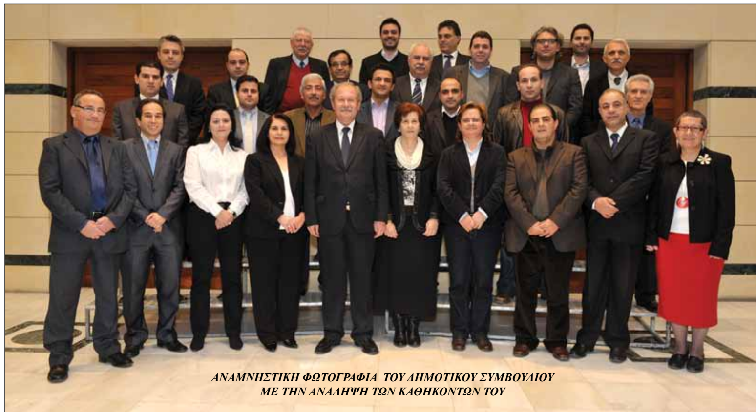
ΑΝΑΜΝΗΣΤΙΚΗ ΦΩΤΟΓΡΑΦΙΑ ΤΟΥ ΔΗΜΟΤΙΚΟΥ ΣΥΜΒΟΥΛΙΟΥ ΜΕ ΤΗΝ ΑΝΑΛΗΨΗ ΤΩΝ ΚΑΘΗΚΟΝΤΩΝ ΤΟΥ