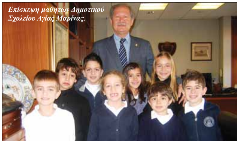
Επίσκεψη μαθητών Δημοτικού Σχολείου Αγίας Μαρίας.