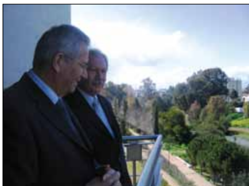
Ο Δήμαρχος Στροβόλου με το ΓΓ του ΑΚΕΛ στο μπαλκόνι του δημορχακικού γραφείου με θέα τον Πεδιαίο ποταμό.