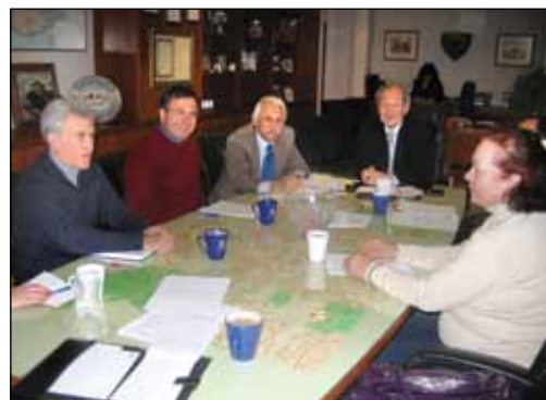
Επίσκεψη αντιπροσωπείας του Κινήματος Οικολόγων Περιβαλλοντιστών με επικεφαλής το Βουλευτή Γιώργο Πεردίκη.