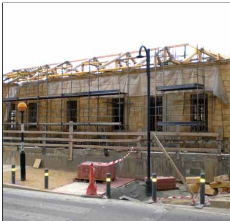
Σε προχωρημένο στάδιο βρίσκονται οι εργασίες αναπαλαίωσης του παλαιού Δημαρχείου.