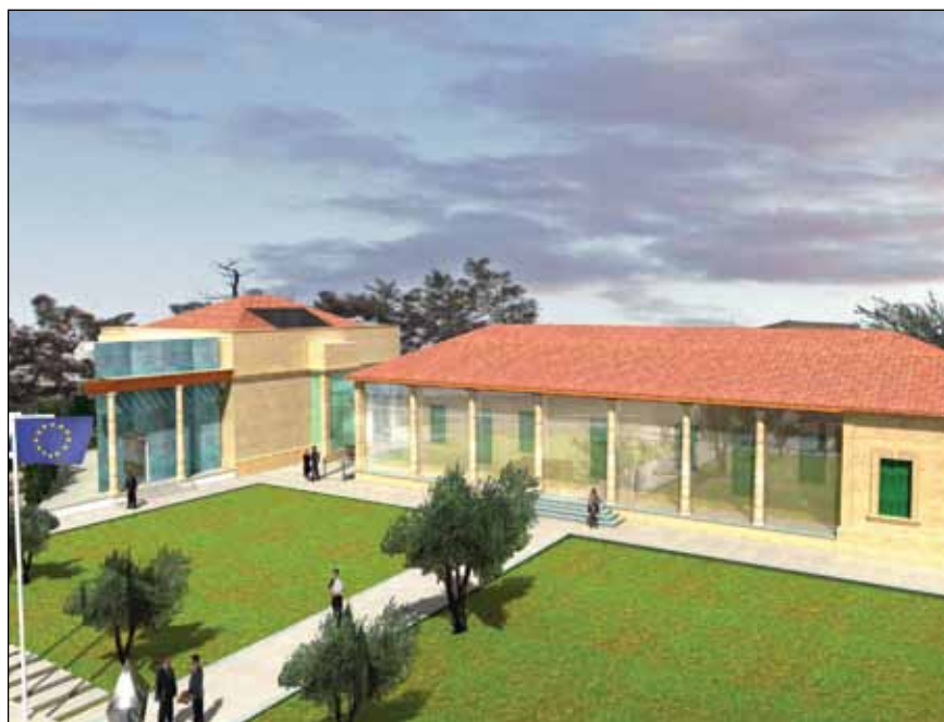
Η μορφή που θα έχει το αναπαλαιωμένο κτίριο του παλαιού Δημαρχείου Στροβόλου φαίνεται στα σχέδια και μακέτες που δημοσιεύουμε.