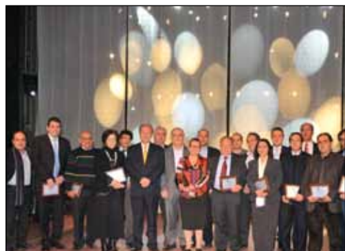
Αναμνηστική φωτογραφία με το απερχόμενο Δημοτικό Συμβούλιο, κατά τον πρωτοχρονιάτικο χορό του προσωπικού του Δήμου.