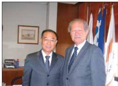
Επίσκεψη του Πρέσβη της Κίνας Li Guobang