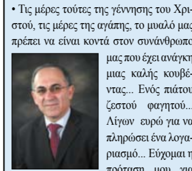
Τον Δήμαρχο Σάββα Ηλιοφότου

Πρόνοιας στον Δήμο μας να υλοποιηθεί, γιατί μόνο έτσι θα μπορούσαμε να διευρύνουμε την κοινωνική μας προσφορά. Μόνο έτσι θα μπορούσαμε να βρεθούμε κοντά στον πάσχοντα. Τον έχοντα ανάγκη της ζεστής και ανθρώπινης αγκαλιάς του Δήμου... Στον Δήμο μας βρίσκονται σε εξέλιξη δύο μεγάλα οδικά έργα. Αρχαγγέλου και