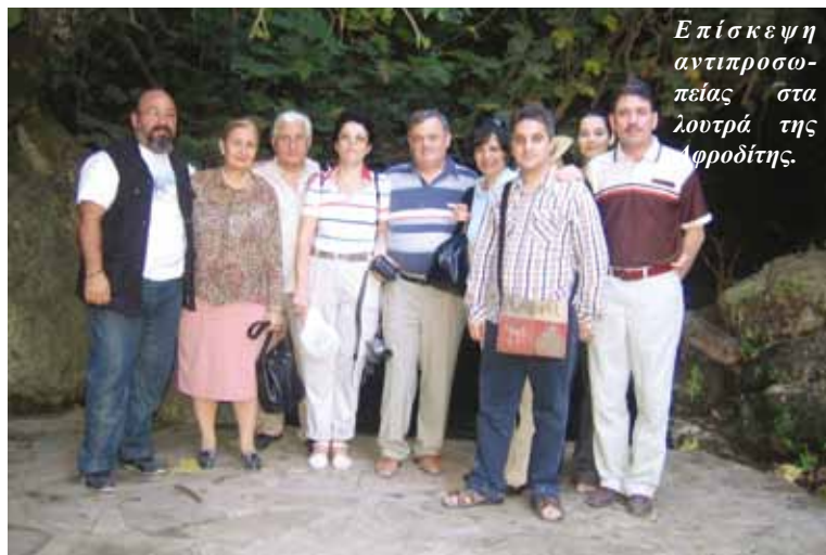
Επίσκεψη αντιπροσωπείας στα λουτρά της Αφροδίτης.

Ο Δήμος Στροβόλου επεκτείνοντας τη συνεργασία με τον αδελφό Δήμο Βουκουρεστίου φιλοξένησε επίσημη αντιπροσωπεία στο Στρόβολο, με στόχο να εγκαθιδρύσει και να εδραιώσει υψηλότερο επίπεδο αδελφότητας, επικοινωνίας, φιλίας και συνεργασίας. Την επίσημη αντιπροσωπεία αποτελούσαν: