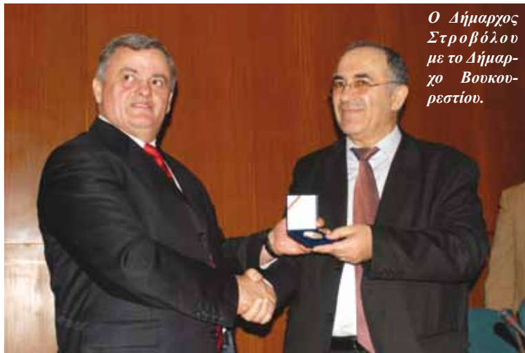
Ο Δήμαρχος Στροβόλου με το Δήμαρχο Βουκουρεστίου.