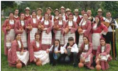
«Ετήσια Παράσταση Λαογραφικού Ομίλου στις 14 Απριλίου 2011»

σχήμα «Ανεράδα», το οποίο ερμήνευσε κυπριακά και παραδοσιακά ελληνικά τραγούδια.